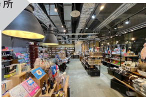
豊川堂グローバルゲート店